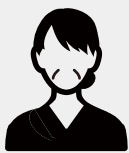
東京都 Aさん (60代)

母は海の近くで育ったこともあり本人の希望で海洋散骨という選択をしました。クルーザーと一緒に乗船しきれいな海に散骨することができて、母も喜んでいてと思いますし、私たち家族もとても清々しい気持ちになりました。